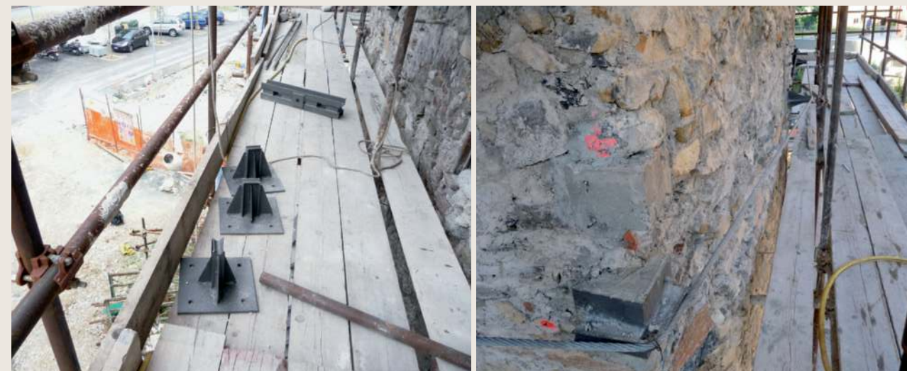
Per ovviare allo stato di degrado e per poter allo stesso tempo essere rispettosi del manufatto e delle sue tracce, si è deciso di optare per una cerchiatura «a cavi di acciaio» su più livelli. In questo modo l'intervento di consolidamento risulta efficace ma, allo stesso tempo, anche poco invasivo.