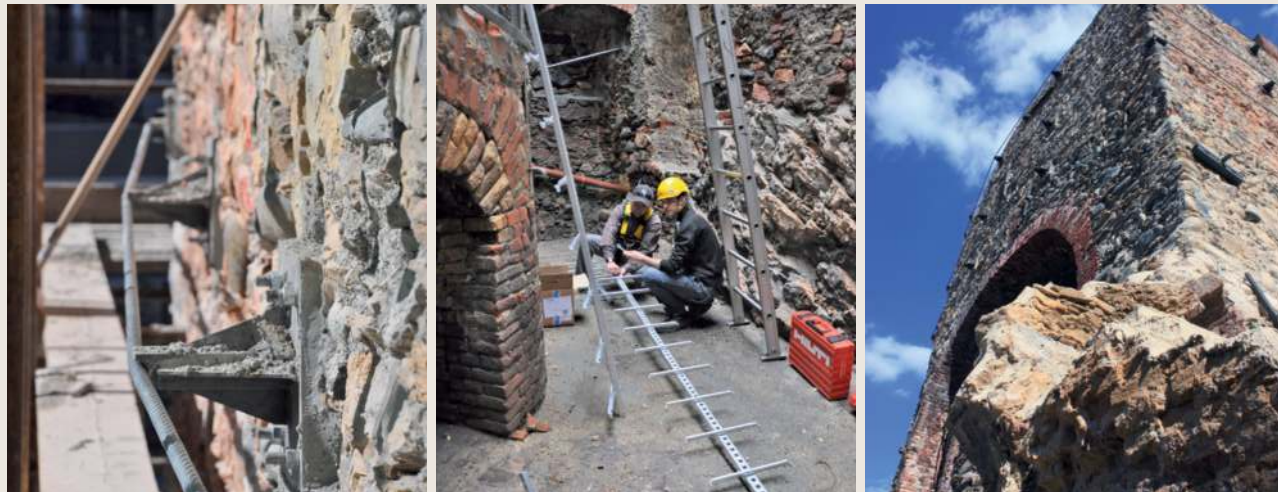
Il sistema di consolidamento adottato è consistito nell'inserimento di tre cerchiature orizzontali a cavo di acciaio nella parte alta della fornace più antica, nella posa di due catene di ancoraggio tra le due fornaci e di limitate integrazioni murarie, con materiale compatibile, con operazioni di «scuci-cuci».

Associazione culturale «Fbc - Fornace Bianchi Cogoleto», Comune di Cogoleto (Ge). Video-intervista del 20 maggio 2011 Rai3 Liguria, «Buongiorno Regione». D. Pittaluga, «Da una lettura dei cantieri del passato: Innovazione, sperimentazione e...», in G. Biscontin, G. Driussi (a cura di), «Governare l'innovazione. Processi, strutture, materiali e tecnologie tra passato e futuro», Atti del convegno di studi «Scienza e Beni Culturali», Bressanone 2011, ed. Arcadia Ricerche, Venezia, 2011, pp. 72-83.